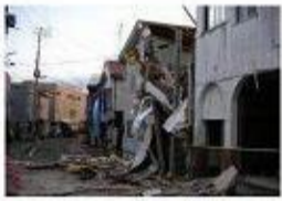
▲新潟県中越地震の様子

中小企業にとってBCPの策定は、自然災害や大火災等の緊急事態において事業中断を最短にとどめ被害を最小化するための企業の危機管理の手法として緊急時の企業存続のみならず、平常時の企業価値向上に大変有意義なものです。是非、ご参加下さい。